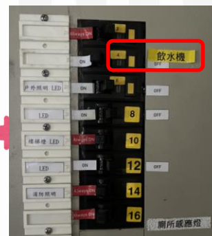
▲已於開關箱內設置漏電斷路器