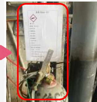
▲氫氣鋼瓶已有危害標示且開關把手已取下。