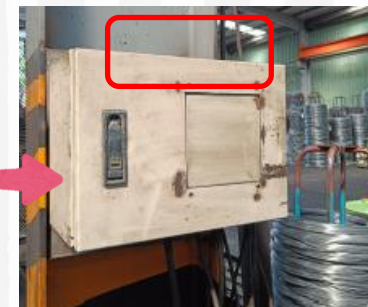
▲已將變壓器移除停用