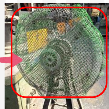
▲已裝套網將過大縫隙包住